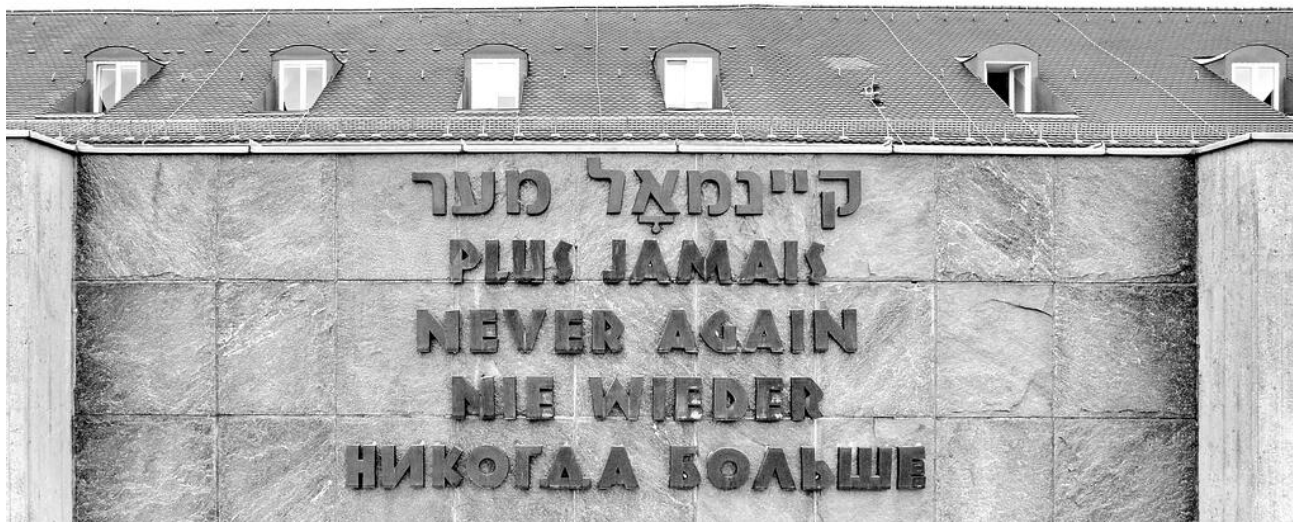
Das Internationale Mahnmal in der KZ-Gedenkstätte Dachau

Die Präambel der Bayerischen Verfassung schreibt das Wissen um das „Trümmerfeld, zu dem eine Staats- und Gesellschaftsordnung ohne Gott, ohne Gewissen und ohne Achtung vor der Würde des Menschen die Überlebenden des zweiten Weltkrieges geführt hat,“ als Ausgangspunkt der freiheitlich-demokratischen Grundordnung fest.