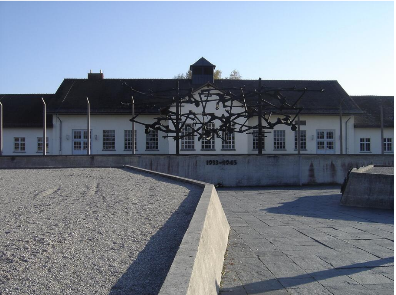
Internationales Mahnmal