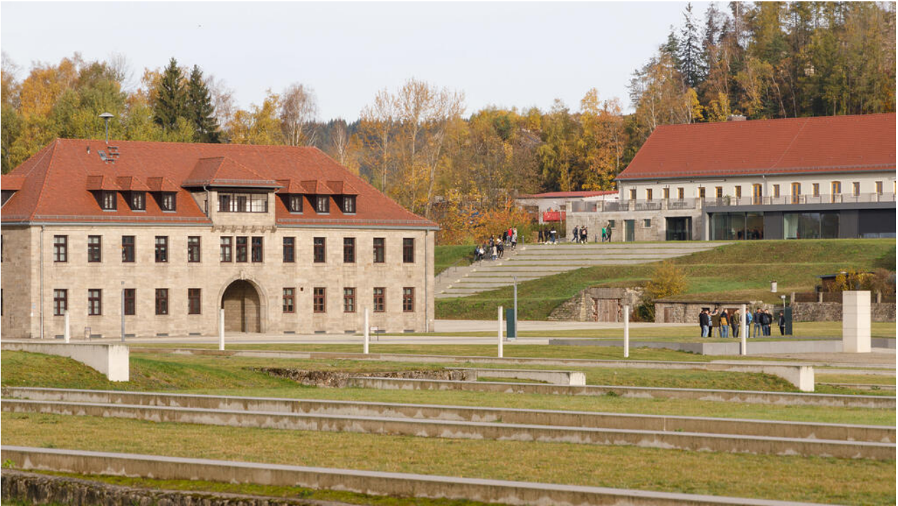
Ehemalige Kommandantur und Bildungszentrum

→ Stiftung Bayerische Gedenkstätten - Seite des Bayerischen Staatsministeriums für Unterricht und Kultus