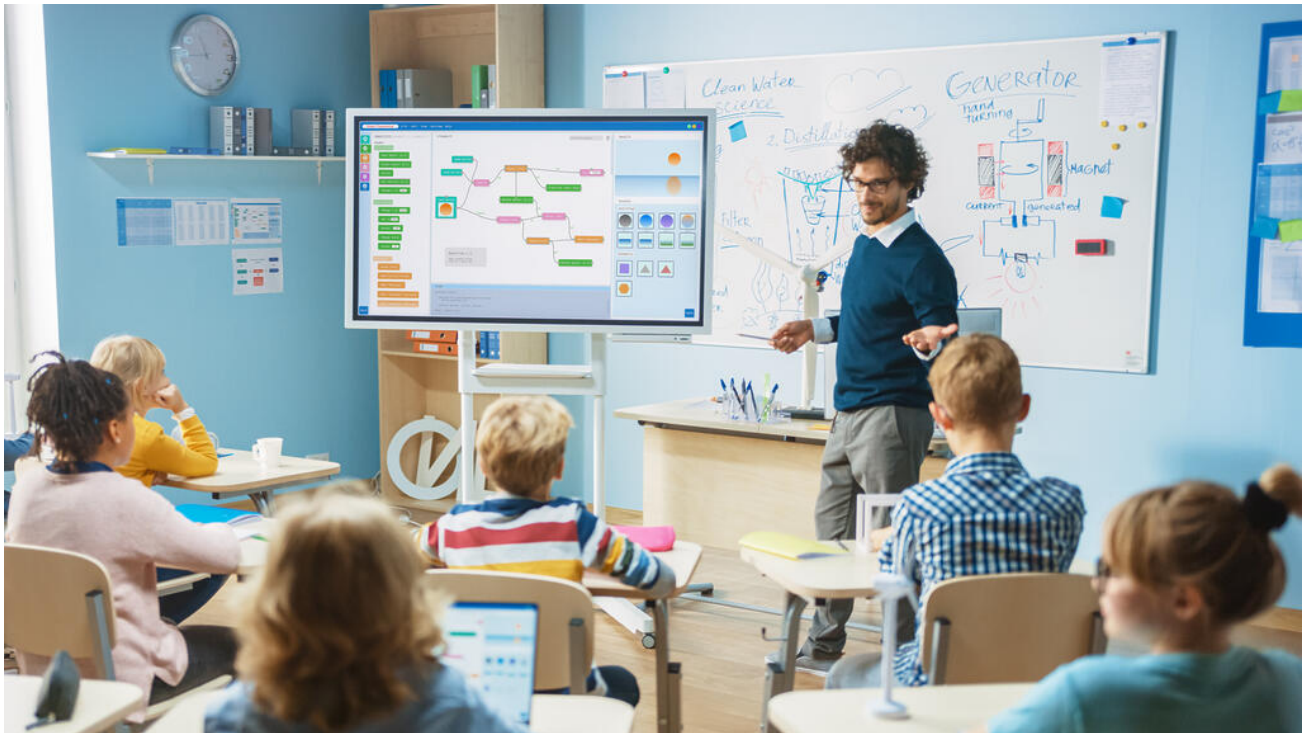
Digitale Klassenzimmer ermöglichen den gewinnbringenden und zeitgemäßen Einsatz elektronischer Medien und Werkzeuge im Unterricht

Im Rahmen des Masterplans BAYERN DIGITAL II unterstützt der Freistaat die kommunalen Sachaufwandsträger öffentlicher Schulen und die Träger staatlich anerkannter sowie genehmigter Ersatzschulen in ihrer Aufgabe, die IT-Ausstattung ihrer Schulen zu verbessern.