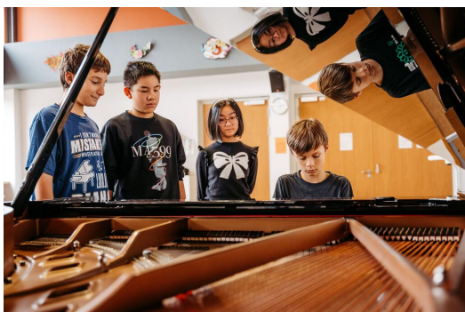
Teilnehmer bei der Musikwerkstatt 2024