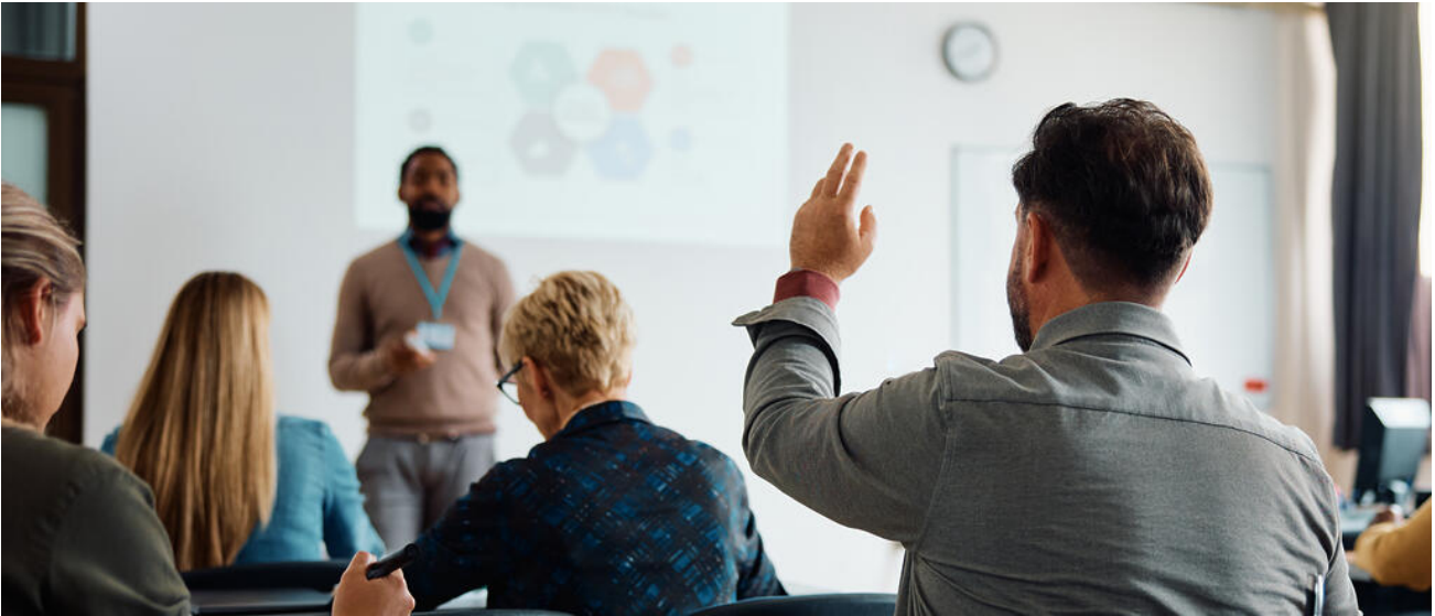
Mit ihrem Weg zur Allgemeinen Hochschulreife bieten die Abendgymnasien vielfältige Zukunftsperspektiven

Das Abendgymnasium führt berufstätige Erwachsene im zwei-, drei- oder vierjährigen Abendunterricht zur → Allgemeinen Hochschulreife https://www.km.bayern.de/lernen/abschluesse/hochschulzugang/allgemeine-hochschulreife .