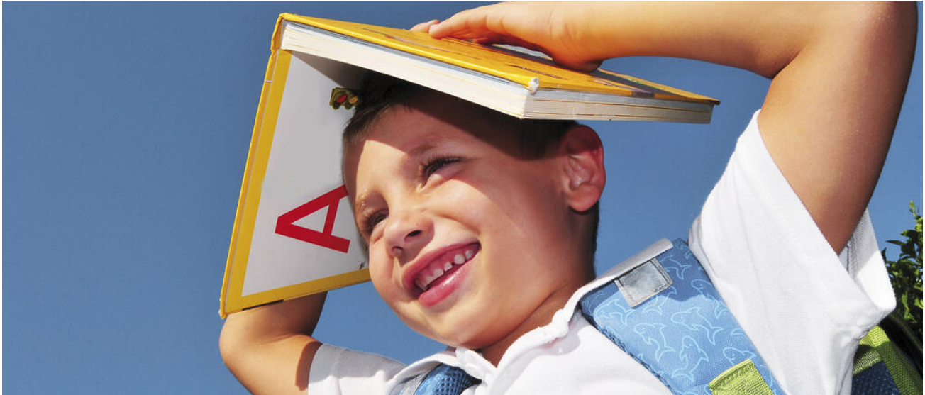
Der erste Schultag – ein besonderer Tag

Im Kindergarten lernen Kinder vieles, an das die Grundschule anknüpft, z. B. mit Papier und Stiften umgehen, zuhören und mit anderen spielen. In der Grundschule erwerben die Kinder zahlreiche Kompetenzen, an die → die weiterführenden Schulen