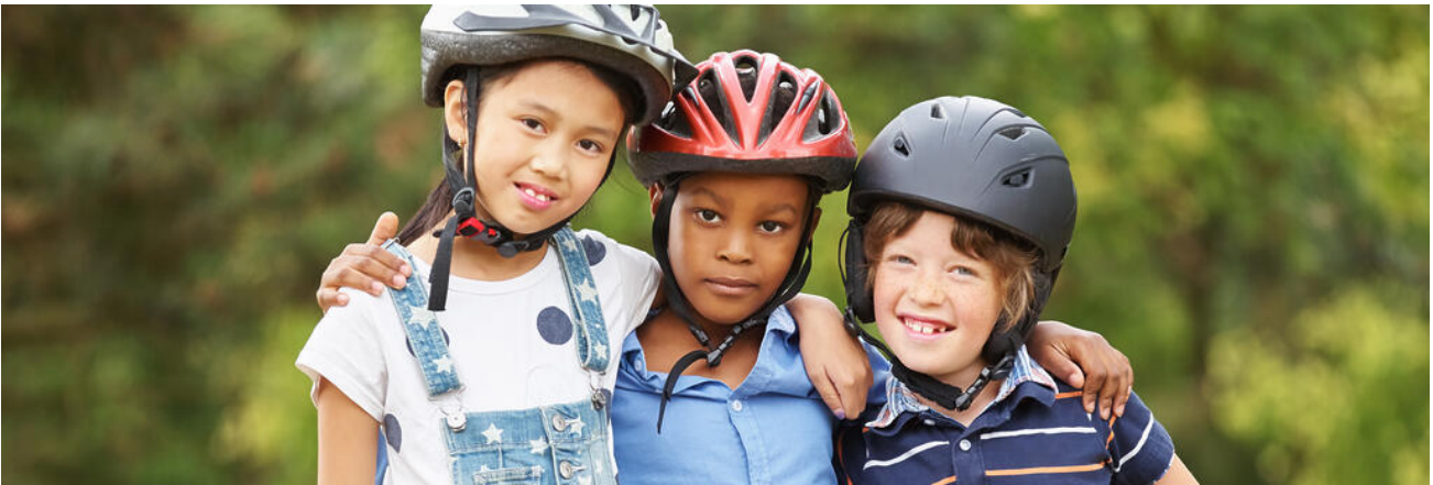
Ein Helm schützt vor Kopfverletzungen

Zu Fuß, mit dem Fahrrad, dem Roller oder dem Schulbus: Schülerinnen und Schüler nehmen individuell am Straßenverkehr teil. Gemeinsam können wir für größtmögliche Sicherheit auf dem Schulweg sorgen. Unfallfrei auf Bayerns Straßen: Dazu gehört höchste Wachsamkeit!