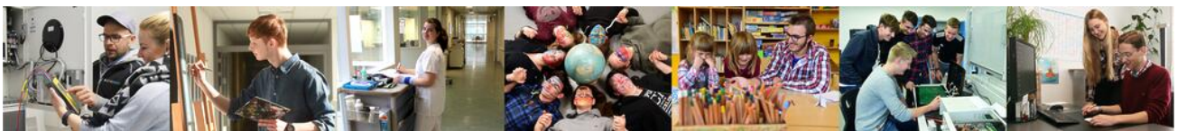
Schülerinnen und Schüler erwerben praktische Erfahrungen in der gewählten Ausbildungsrichtung.

Die Fachoberschule bietet sieben Ausbildungsrichtungen. Nach Begabung und Neigung kann eine der Ausbildungsrichtungen frei gewählt werden.