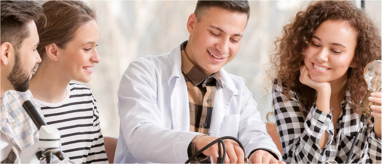
Das Naturwissenschaftlich-technologische Gymnasium setzt einen Schwerpunkt auf den MINT-Bereich

Das Naturwissenschaftlich-technologische Gymnasium setzt seinen Schwerpunkt im MINT-Bereich. Insbesondere durch das deutlich erhöhte Stundenmaß in den Fächern Chemie, Physik und Informatik erhalten die Schülerinnen und Schüler die Gelegenheit, sich intensiv mit naturwissenschaftlichen und technologischen Fragestellungen unter Berücksichtigung der wechselseitigen Abhängigkeiten von Mensch und Natur auseinanderzusetzen. Ausgehend von alltagsnahen Phänomenen ermöglichen praxisbezogene Schülerübungen den Zugang zu einer naturwissenschaftlichen Welterschließung. Gleichzeitig wird durch Modellieren die Abstraktionsfähigkeit und durch die in diesem Zusammenhang notwendigen Entscheidungsprozesse das Urteilsvermögen der Schülerinnen und Schüler geschärft.