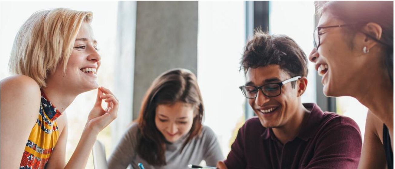
Am Sprachlichen Gymnasium liegt ein Schwerpunkt auf sprachlicher und interkultureller Bildung

Am Sprachlichen Gymnasium erlernen die Schülerinnen und Schüler drei oder mehr Fremdsprachen, darunter mindestens zwei moderne Fremdsprachen. Sprachliche, kulturelle und interkulturelle Bildung und Kompetenzen stehen vor dem Hintergrund unseres europäischen Gedankens und unserer Lebenswelt, in welcher der Vielfalt von Kulturen und Sprachen eine besondere Bedeutung zukommt, im Fokus.