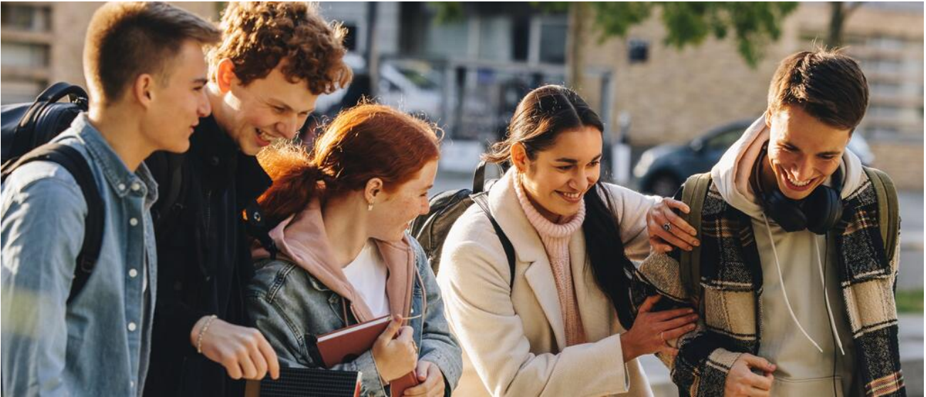
Das bayerische Gymnasium ist der direkte Weg zur Allgemeinen Hochschulreife