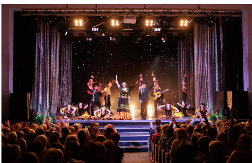
Theateraufführungen und Konzerte sind die Höhepunkte des Schuljahres

Beim Mitwirken in Theatergruppen oder bei Musical-Aufführungen wird Kreativität freigesetzt, Neugier geweckt und Selbstbewusstsein gestärkt. Neben dem pädagogischen Wert fördert es vor allem auch den Zusammenhalt.