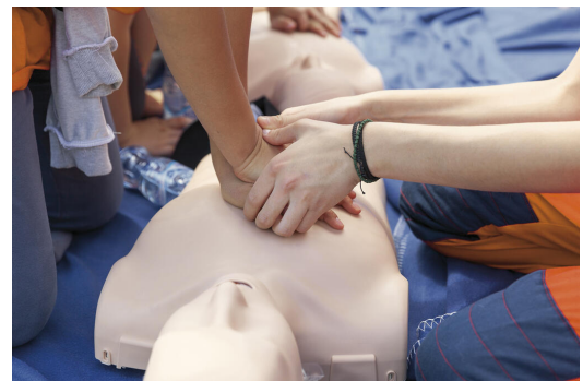
Üben für den Ernstfall

Durch solche und ähnliche Aufgaben lernen die Heranwachsenden, sich in die Gemeinschaft einzubringen und lernen früh, Verantwortung für andere zu übernehmen.