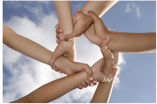
Gemeinsam werden Lösungen gefunden

Die Tutoren sind in den ersten Schulwochen Ansprechpartner der fünften Klassen und machen diese mit der neuen Schule vertraut. Sie organisieren gemeinsame Aktionen (z. B. Schulhausrallye, Spielenachmittag, Hausaufgabenstunde). Um ihre Aufgabe verantwortungsvoll wahrnehmen zu können, werden Tutoren von Lehrkräften betreut und in Seminaren geschult.