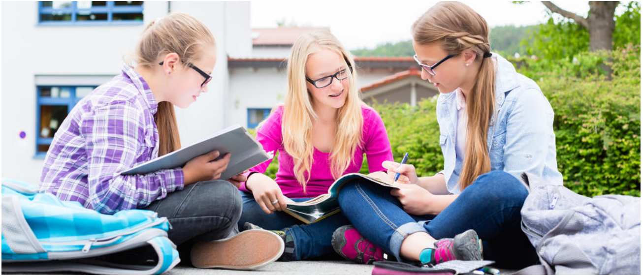
An der Mittelschule die Welt begreifen

Jedem Kind seinen persönlichen Weg: Eine grundlegende Allgemeinbildung, die Vermittlung von Alltagskompetenzen und die gründliche Vorbereitung auf die Berufswelt sind die Schwerpunkte der Mittelschule.