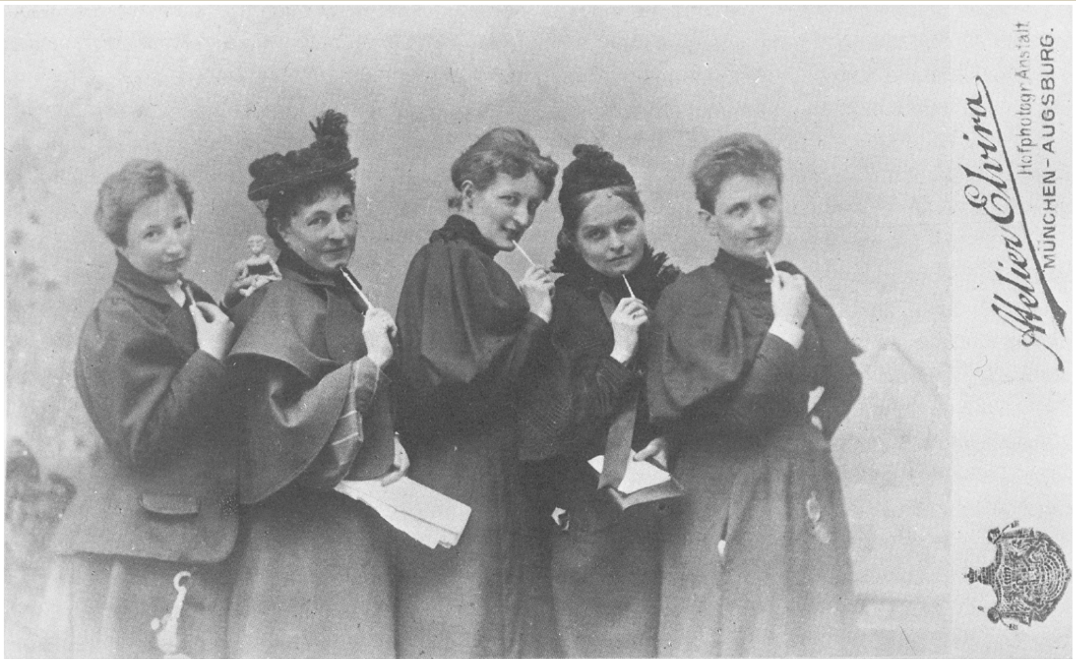
Anita Augspurg kämpfte mit ihren Gefährtinnen vom Deutschen Verband für Frauenstimmrecht für das aktive und passive Wahlrecht für Frauen. Hier im Bild von links: Dr. Anita Augspurg, Marie Stritt, Lily von Gizycki, Minna Cauer und Sophia Goudstikker. Nachdem ihr selbst zunächst eine weiterführende Schulausbildung verwehrt wurde, befreite sie sich allmählich aus den bürgerlichen Zwängen und wurde schließlich Deutschlands erste promovierte Juristin. Ihre Ziele vertrat sie öffentlichkeitswirksam nach außen und versuchte mit spektakulären Aktionen auf die Belange von Frauen aufmerksam zu machen.

Gemeinfrei; Mit freundlicher Unterstützung des FrauenMediaTurm, Köln