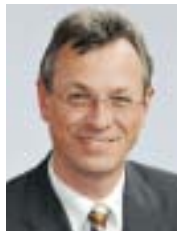
Kultusminister Siegfried Schneider