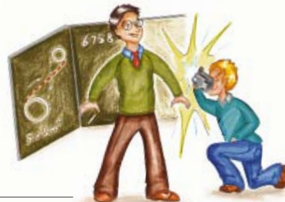
Illustration: Claudia Bauer, Pinselstrich&Farbenspiel

Hat ein Schüler im Schulgebäude oder auf dem Schulgelände ein Mobiltelefon oder ein anderes digitales Speichermedium ohne Erlaubnis der Lehrkraft eingeschaltet, so kann das Gerät vorübergehend einbehalten werden (vgl. Art. 56, Abs. 5 BayEUG). Daneben können auch die schulischen Erziehungs- und Ordnungsmaßnahmen nach Art. 86 BayEUG getroffen werden. Darüber hinaus ist jedoch zu beachten, dass möglicherweise eine Strafbarkeit nach § 33 Kunsturhebergesetz (KunstUrhG) in Betracht kommt. Wer z. B. eine Fotografie eines anderen ohne dessen Einwilligung verbreitet oder öffentlich zur Schau stellt, verletzt dessen besonderes, verfassungsrechtlich verankertes Persönlichkeitsrecht des Rechts am eigenen Bild nach § 22 KunstUrhG.