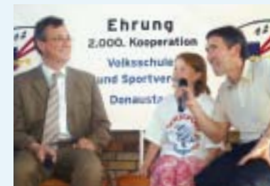
Staatsminister Schneider bei der Ehrung der 2000. Kooperation von Schule und Verein

▶ Unsere Aufgaben ▶ Sport ▶ Schulsport ▶ Sport nach 1 in Schule und Verein