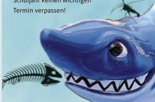
Illustration: Stephanie Vogel, Wälpertskirchen

Vielleicht haben Sie in dieser Sommerausgabe der EZ unseren bewährten Ferienkalender vermisst. Durch das verkleinerte Format der Elternzeitschrift war es nicht mehr möglich, den Ferienkalender hier abzdrukken. Sie müssen aber dennoch nicht auf ihn verzichten: Den ansprechend gestalteten Ferienkalender des Kultusministeriums gibt es in diesem Jahr zum Herunterladen im Netz. Unter www.km.bayern.de lässt er sich in verschiedenen Größen ausdrucken. Damit Sie auch in diesem Schuljahr keinen wichtigen Termin verpassen!