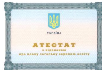
Zeugnis (Atestat) über die vollständige allgemeine mittlere Bildung mit Auszeichnung