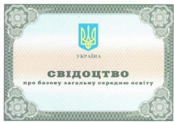
Zeugnis (Svidoctvo) über die Basisschulbildung