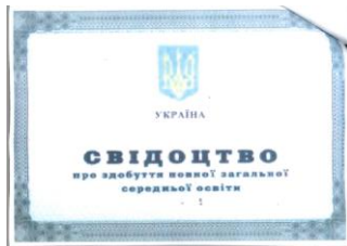
Zeugnis (Svidoctvo) über die vollständige allgemeine mittlere Bildung

Der Erwerb der vollständigen allgemeinen mittleren Bildung nach 11 Schuljahren (Zeugnis über die vollständige allgemeine mittlere Bildung (повна загальна середня освіта/povna zahal'na serednja osvita)) eröffnet in der Ukraine den Hochschulzugang. Voraussetzung für die Aufnahme eines Hochschulstudiums in der Ukraine ist darüber hinaus die erfolgreiche Teilnahme an der sog. Externen unabhängigen Bewertung (Зовнішнє незалежне оцінювання/Zovnišné nezaležne ocinjuvannja).