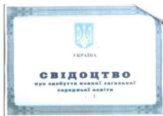
Zeugnis (Svidoctvo) über die vollständige allgemeine mittlere Bildung

Der Erwerb der vollständigen allgemeinen mittleren Bildung nach 11 Schuljahren (Zeugnis über die vollständige allgemeine mittlere Bildung (повна загальна середня освіта/povna zahal'na serednja osvita)) eröffnet in der Ukraine den Hochschulzugang. Voraussetzung für die Aufnahme eines Hochschulstudiums in der Ukraine ist darüber hinaus die erfolgreiche Teilnahme an der sog. Externen unabhängigen Bewertung (Зовнішнє незалежне оцінювання/Zovnišné nezaležne ocinjuvannja).