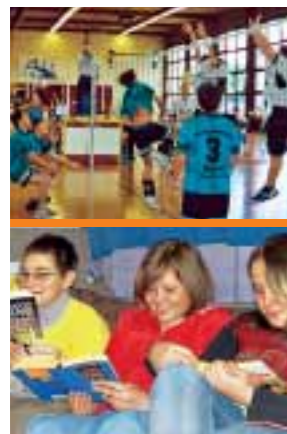
Sport und Lesen – zwei von vielen Schwerpunkten

Von den Schülern werden Fleiß und Disziplin erwartet. Kreativität, Teamfähigkeit und selbstbewusstes Auftreten