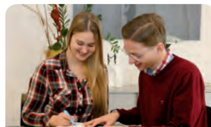
Wirtschaft und Verwaltung