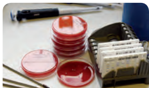
Agrarwirtschaft-, Bio- und Umwelttechnologie