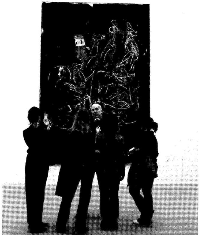
Schülerinnen interviewen Georg Baselitz, der die Schirmherrschaft des Projekts Audiopilot übernommen hat, zu seinem Gemälde ›Bildsechzehn‹.

Weitere Information: info@stipimo.de www.stipimo.de/projekte/index.html