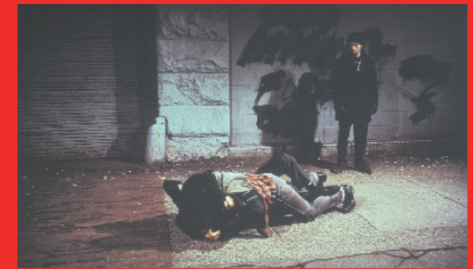
Jeff Wall, Fight on the Sidewalk, 1994, Sammlung Moderne Kunst, Pinakothek der Moderne Courtesy