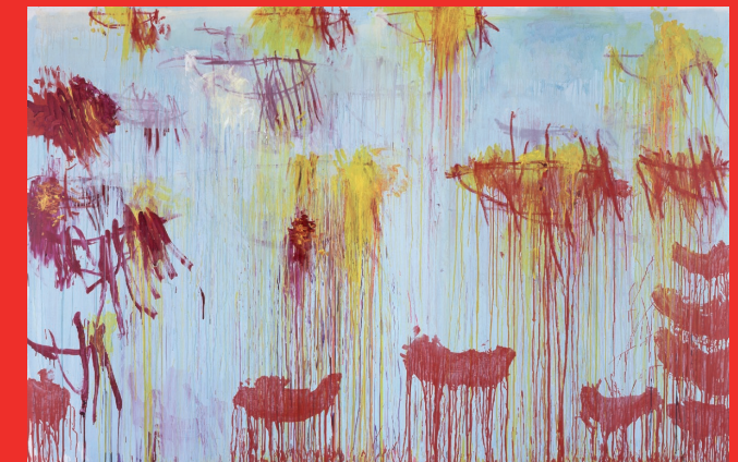
Cy Twombly, Lepanto XI, 2001, Museum Brandhorst © Cy Twombly.

Seminar-Termine: 15.–20.02.2011 und 26.–31.07.2011. Anmeldeschluss: Freitag, 26.11.2010 (Seminar 1), bzw. Freitag, 27.05.2011 (Seminar 2).