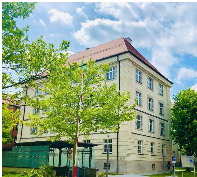
Barrierefrei: Die Staatliche Schulberatung Oberbayern-West

Unser Beratungsangebot ist neutral, streng vertraulich, lösungsorientiert, für alle Schularten, kostenfrei und freiwillig.