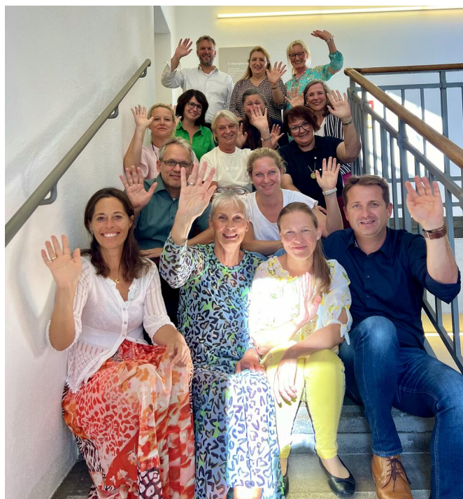
Team der Staatlichen Schulberatungsstelle für Oberbayern- West

Ein herzliches Grüß Gott bei der Staatlichen Schulberatungsstelle Oberbayern-West!