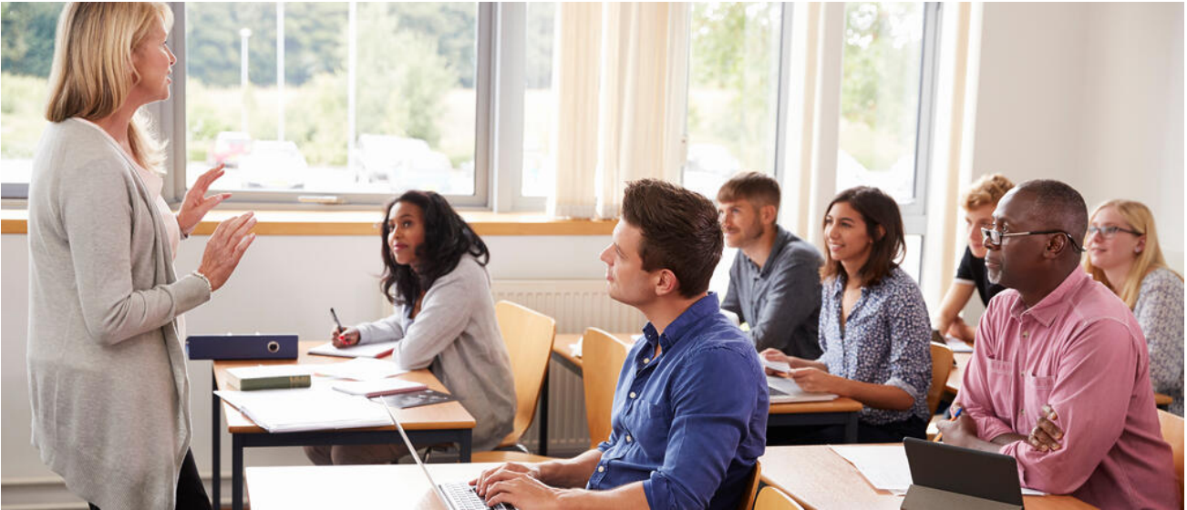
Am Kolleg werden junge Erwachsene zur Allgemeinen Hochschulreife geführt

Das Kolleg führt Erwachsene in zwei, drei oder vier Jahren zur Allgemeinen Hochschulreife .