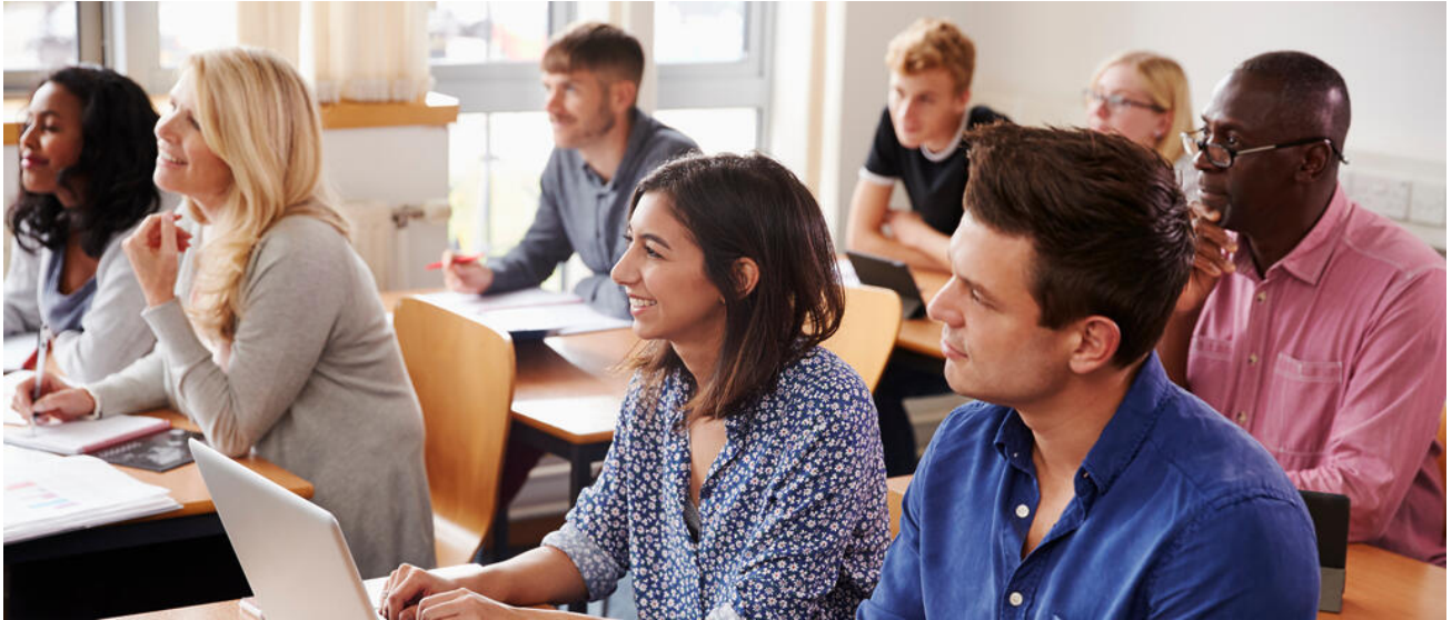
An der Abendrealschule können berufstätige Erwachsene den Realschulabschluss nachholen

Die Abendrealschule führt Berufstätige in drei bis vier Jahren zum Realschulabschluss . Der Unterricht entspricht dem Lehrplan der Realschule , die Anzahl der Fächer ist jedoch geringer. Bereits im ersten Schuljahr entscheidet man sich für eine Wahlpflichtfächergruppe.